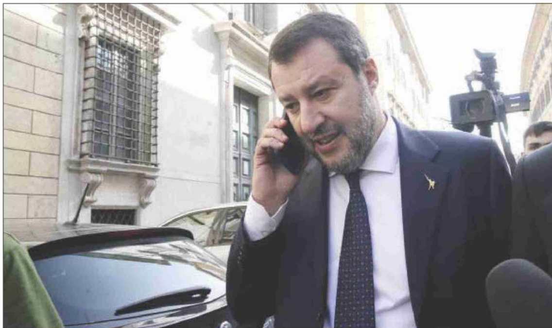
Il neo ministro alle Infrastrutture. Matteo Salvini

Una impresa, impegnata nella realizzazione di un'opera, vive solo se esiste una correlazione certa tra avanzamento lavori e pagamento degli stati avanzamento lavori